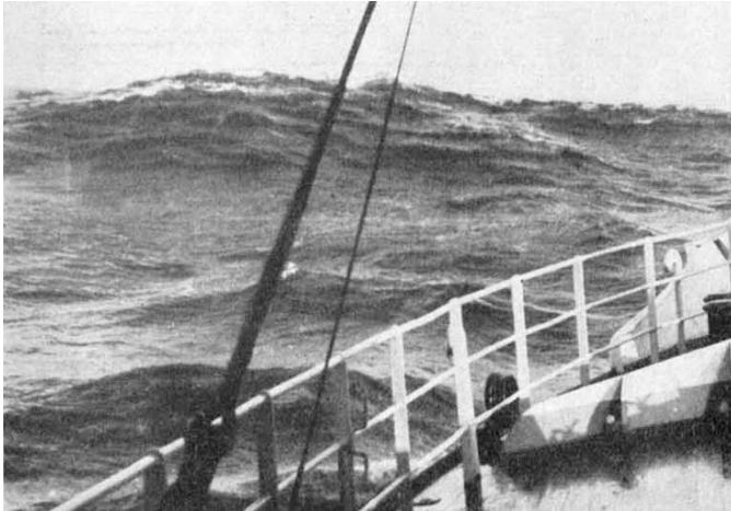
Die „Meerkatze“ zwischen den Wellenberg bei Windstärke 10

getrieben und verleiht diesem dann einen weißlich - grauen Anblick. Zur selben Zeit setzt dann auch das charakteristische dumpfe Getöse und Heulen in der Atmosphäre um das Schiff ein.