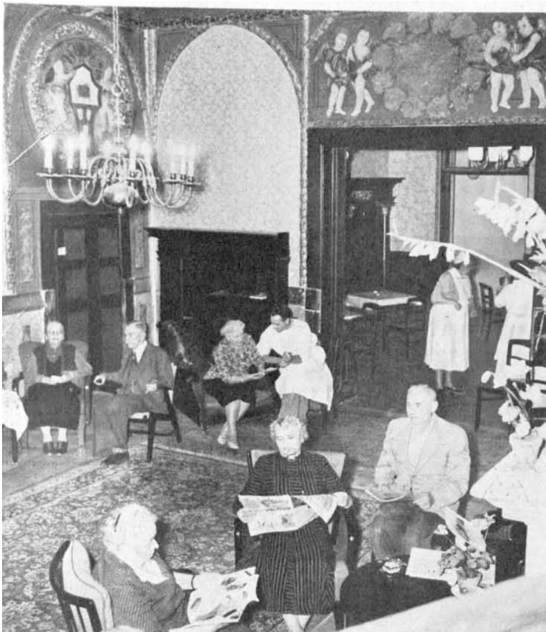
Im Gesellschaftsraum des Hauses.

Mit einem Darlehen der Dernburgschen Erben wurde jenes Palais im stillen Grunewaldviertel wieder auf- und umgebaut, entsprechend dem neuen Zweck. Der Schwiegervater eines der noch in Berlin lebenden Dernburgs war selbst lange Jahre Oberingenieur des Überlandwerkes Ostpreußenwerk in Friedland.