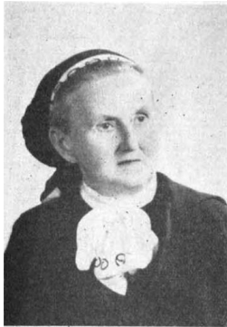
Erminia von Olfers-Batocki

Die ostpreußische Heimatdichterin starb am 14. Dezember 1954 in Bad Harzburg