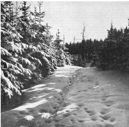
Wildfährten in der Rominter Heide