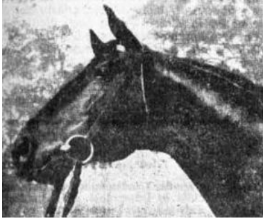
Ein charmanter Kopf. Der Trakehner Hengst Komet, Beschäler in Schmoel, geboren 1952 von Goldregen aus der Kokette.