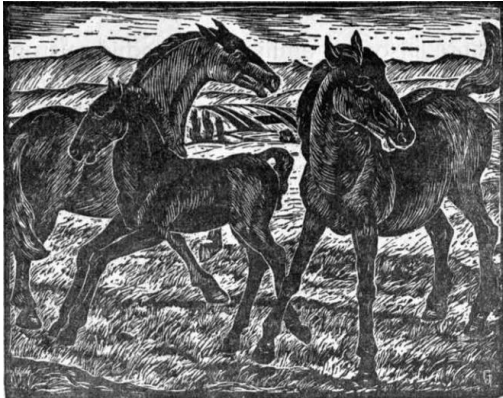
In der Koppel / Holzschnitt von Emmi v. Lill jeström