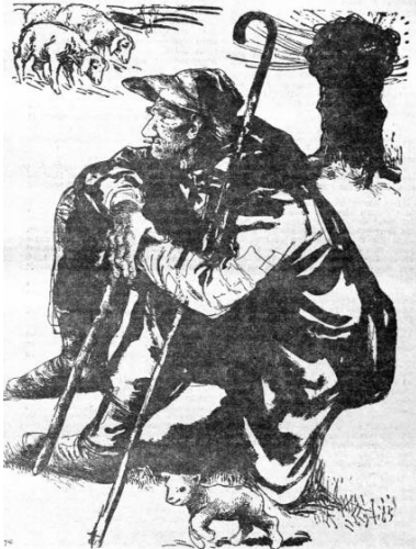
Der Schäfer / Zeichnung von Hanna Nagel

Jugend- und Kinderbeilage der Ostpreußen-Warte. Nummer 4, April 1960.