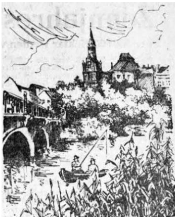
Zeichnung, Lyck / Partie an der Suermondbrücke

Über den Zustand von Friedhof und Krieger-Friedhof muss ich Euch nun ausführlicher berichten. Der Krieger-Friedhof sieht noch- am besten aus. Dort hat man vor allem keine Gräber erbrochen. Auf dem Krieger-Friedhof ist eben alles nur zugewuchert und verwildert. Der andere Friedhofsteil aber sieht grauenerregend aus! Immer wieder bin ich dort auf erbrochene Gruften und Grabstellen gestoßen. Wo die Leichenschänder Reichtum bei den Toten vermuteten, haben sie alles aufgegraben oder aufgebrochen. Heute liegen an diesen Stellen Gebeine herum. Was an Denkmälern inzwischen nicht gestohlen ist, hat man mutwillig zertrümmert. Viele wertvolle Steine aber sind abmontiert, aufgeladen und nach Polen transportiert worden. Einige „umgearbeitete“ Lycker Grabdenkmäler habe ich zum Beispiel in Grajewo gesehen! Von dem Judenfriedhof ist gar nichts mehr zu sehen. Er ist eingeebnet worden.