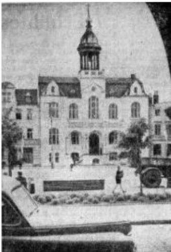
Bild oben zeigt einen Blick aus den Arkaden auf das Rathaus, das jetzt Sitz der polnischen Stadtverwaltung ist. —