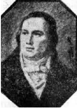
Alexander Graf zu Dohna