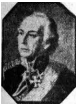
Graf Yorck von Wartenburg

Am 29. Januar 1960 sind erst 100 Jahre vergangen, seit der Rufer für Vaterland und Freiheit, Ernst Moritz Arndt, sein Leben in der jetzigen Bundeshauptstadt Bonn beschloss.