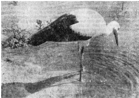
Junger Storch, aufgenommen auf der Kurischen Nehrung bei Rossitten.

Aus seinem segensreichen Wirken über fast drei Jahrzehnte sei insbesondere seiner Vogelzugforschungen gedacht. Das moderne Verfahren der Beringung hat ihn volkstümlich und berühmt gemacht und der Vogelwarte Rossitten Weltruf eingetragen.