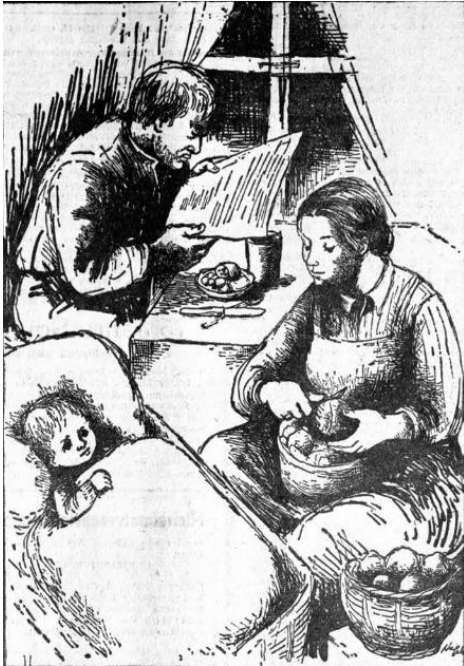
Die Familie / Zeichnung von Hanna Nagel