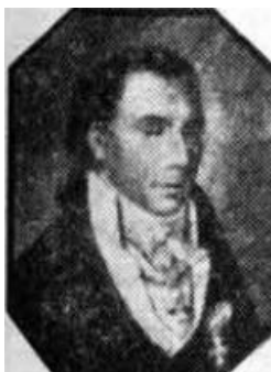
Theodor von Schön

Arndt berichtet selbst über seine Eindrücke: „Den 21. Januar 1813 gegen Abend kamen wir von Gumbinnen in Preußens Hauptstadt, in Königsberg, an. Stein versammelte hier die preußischen Würdenträger und angesehensten Männer; unter ihnen voranzustellen: der ehemalige Minister Graf Alexander zu Dohna und der Präsident von Schön ... Merkwürdig auffallend war mir und jedem, welchem er zum ersten Mal erschien, der General York, der berufen war, gleichsam den ersten preußischen Anfang zu machen, eine starre, entschlossene Gestalt, eine breite gewölbte Stirn voll Mut und Verstand, um den Mund ein hartes sarkastisches Lächeln. Er sah aus wie scharf gehacktes Eisen; hatte es ferner gegen die Welschen in vielen Schlachten wohl erwiesen“.